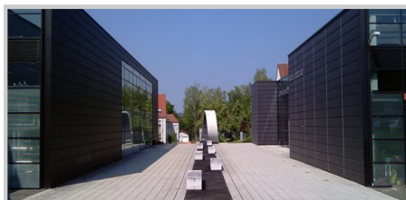
Fotografie: WHZ – Areál vysoké školy Scheffelberg