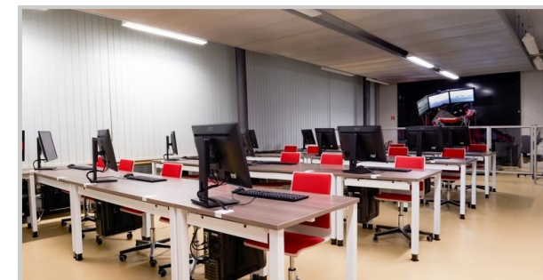
Laboratoř simulace jízdy na WHZ