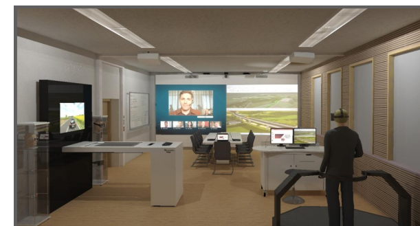
Interaktivní seminární, cvičná a zasedací místnost na WHZ