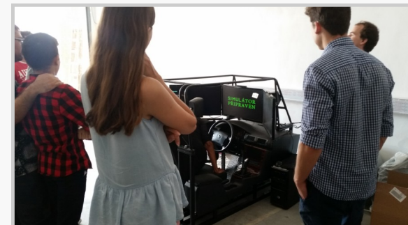
Fotografie: WHZ – Seminární místnost a laboratoř ČVUT Děčín

Možnosti výuky a výcviku na obou vysokých školách vyžadují kromě zprostředkování nových teoretických znalostí i osvojení schopností a dovedností při používání nových technik a technologií v laboratořích. Kromě teoretické výuky probíhají ve všech třech vybudovaných resp. rozšířených laboratořích praktická cvičení. Zde mohou studentky a studenti řešit úkoly z praxe.