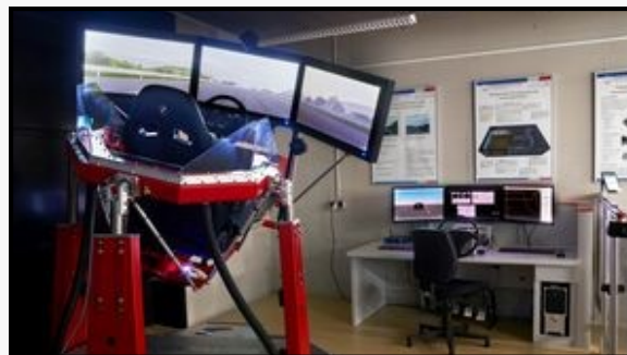
Laboratoř simulace jízdy s multifunkční pohybovou plošinou