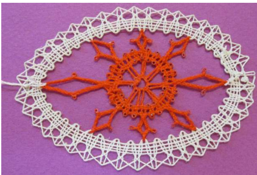
Obrázek 5: Krajka "Velikonoční závěsné vajíčko"