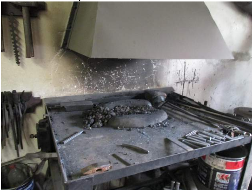
Obrázek 46: Kovářská výheň

Jeho oborem je zámečnictví a kovářství. Často vyrábí ploty, vrata, brány, rekonstruuje nebo vyrábí schody. Je schopen na zakázku vyrobit všechno. V současnosti lidé často nosí fotografie nebo obrázky, jak by chtěli, aby konečný výrobek vypadal.