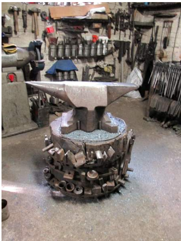
Obrázek 43: Kovadliny

Nástroje: Ková využívá tradiční nástroje a postupy. Nejdříve nástrojem je kovadlina a pec s ventilátorem. Tradiční metody na rozhoření ohně se již nevyužívají. Tradiční metody se dle kováře nachází v muzeu v Bečov nad Teplou. Dalšími používanými nástroji jsou kladiva, buchary atd.