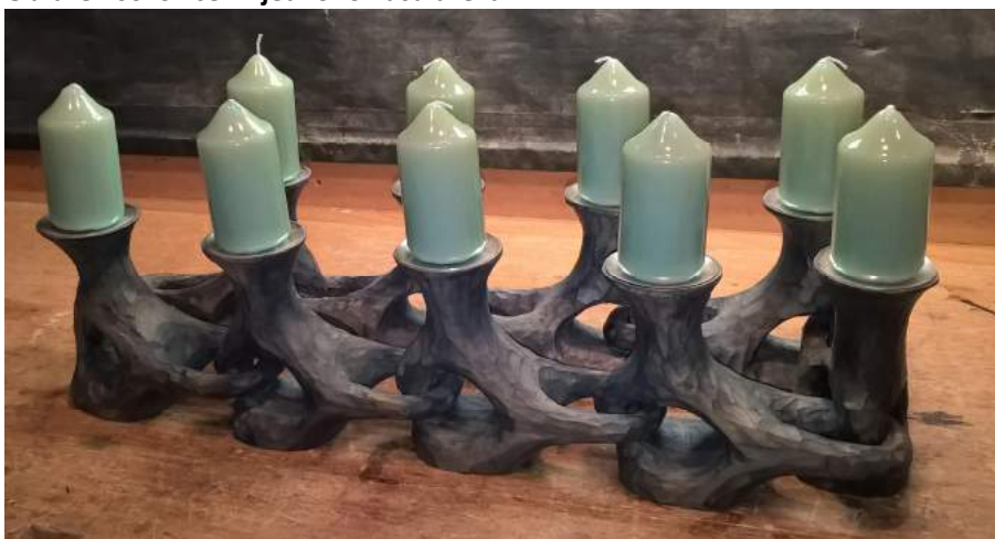
Obrázek 60: Svícen z jednoho kusu dřeva

Spojované/uvolované v cí výrobky tvořené z jednoho kusu dřeva, například svícen, který je pospojován oky a žebry, nebo figurky betléma, vzájemně spojené. Vlastní tvorba a nápad.