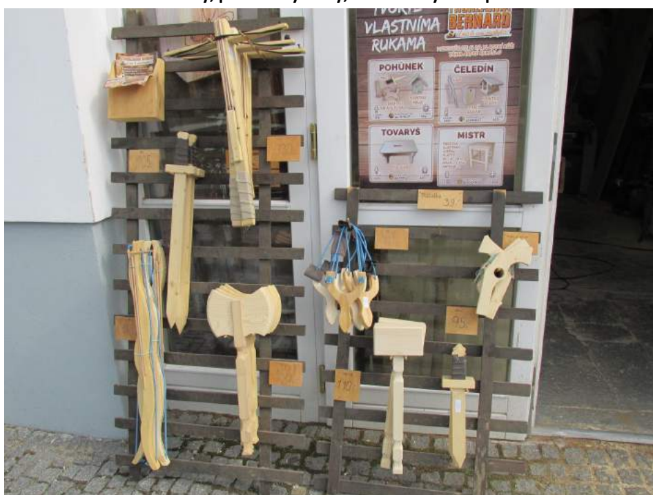
Obrázek 32: Ukázka tvorby, plakát s výrobky, které lze vyrábět při řemeslném kurzu

Specializuje se na dřevěné výrobky, jako například: schody, nábytek (dveře, skříně), ale i menší výrobky, jako například budky, skříňky a další. Zhotovuje repliky starého nábytku a renovuje starší nábytek. Poskytuje také odborné kurzy pro veřejnost. Lidé si zde mohou vyzkoušet práci se dřevem. Vyrobit si lze podle úrovně a v kurzu různé předměty. Ti mladší si mohou vyrobit dřívko, malé krmítko anebo zvířátko na kolečkách. Starší a zkušenější mohou vyrábět luk, například budku, velké krmítko anebo stoličku.