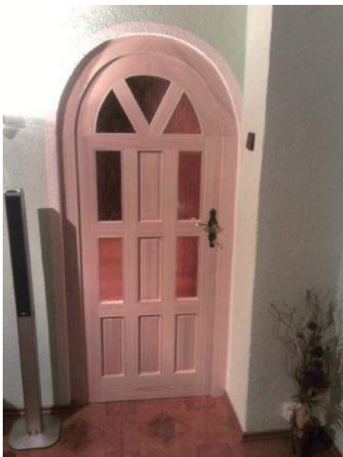
Obrázek 37: Dveře se skleněnou výplní

Vyrábí samozřejmě nejčastěji z dřeva, ale občas musí pracovat i se skleněnými komponenty, například při výrobě dveří. Vyšlívá dřevotřísku i masiv. Pro zpracování nábytku z masivu vyšlívá nejčastěji borovici. Pro výrobu je dle něj také vhodný dub, který jílk není tak levný. Pracuje v poměru 1:1 s dřevotřískou a masivem. Pokud si zákazník vybere zakázku z dřevotřísky, hlavním důvodem je nižší cena.