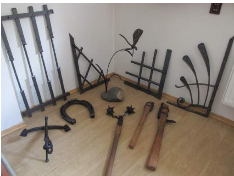
Obrázek 41: Ukázka z tvorby Ivo Rudolfa