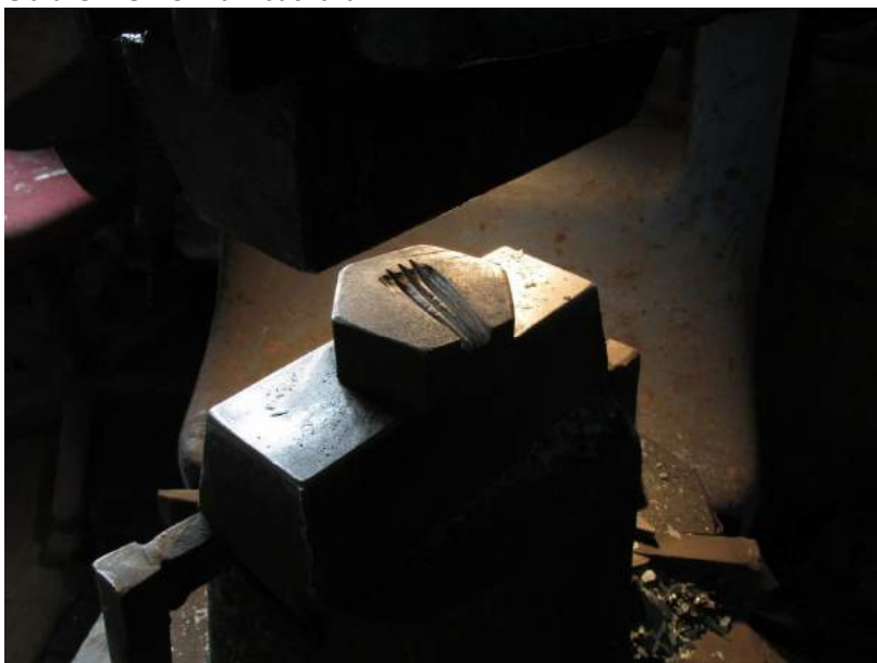
Obrázek 48: Forma v bucharu

Typické pro region je podle kováře to, že u něj není moc kovářů (kovářů i postupně tím vymění). Po kovářském řemeslu je poptávka, kovář má zakázky i na rok dopředu.