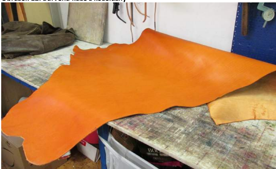
Obrázek 12: Barvená kůže z koželužny