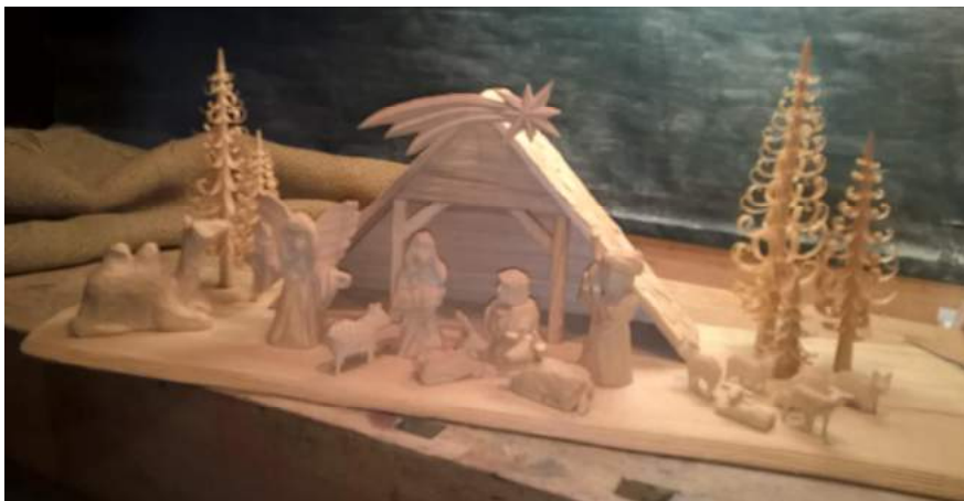
Obrázek 58: Betlém

Betlémy o v nuje se jim od za átku. Prvotním impulzem byla výroba ástí betlém jako šsubdodávka o pro n koho jiného. Pozd ji za al d lat betlémy sám. D lá betlémy, které se dají dopl ovat a roz-i ovat dle p ání zákazníka. Základ betlém tvo í svatá Rodina a zbytek si mohou zákazníci navolit dle svého p ání.