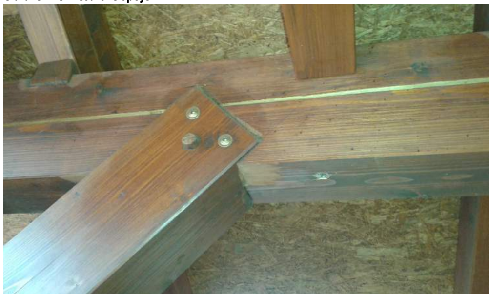
Obrázek 28: Tesařské spoje