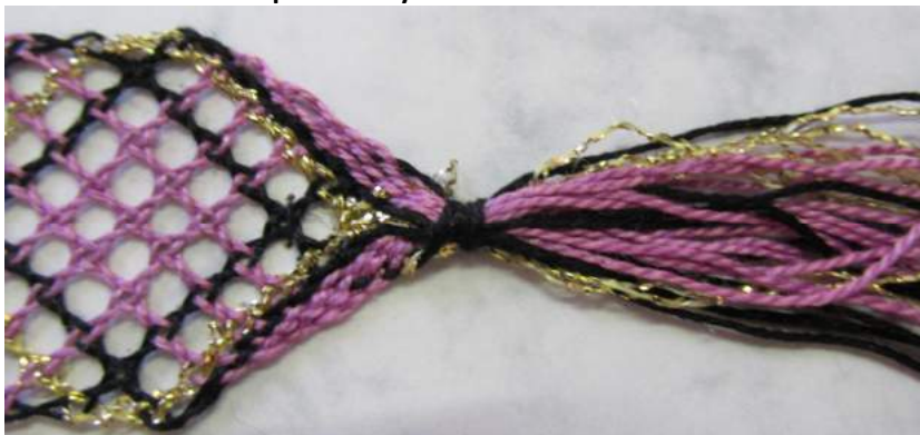
Obrázek 8: Detail střapce záložky