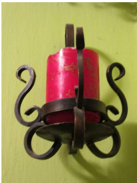
Obrázek 53: Ukázka tvorby pana Částky