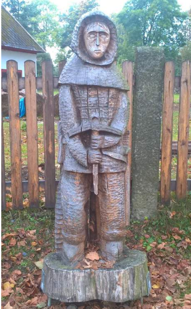
Obrázek 63: Vyřezávaná postava v životní velikosti

Ahoj sousede. Hallo Nachbar. Interreg V A / 2014 – 2020