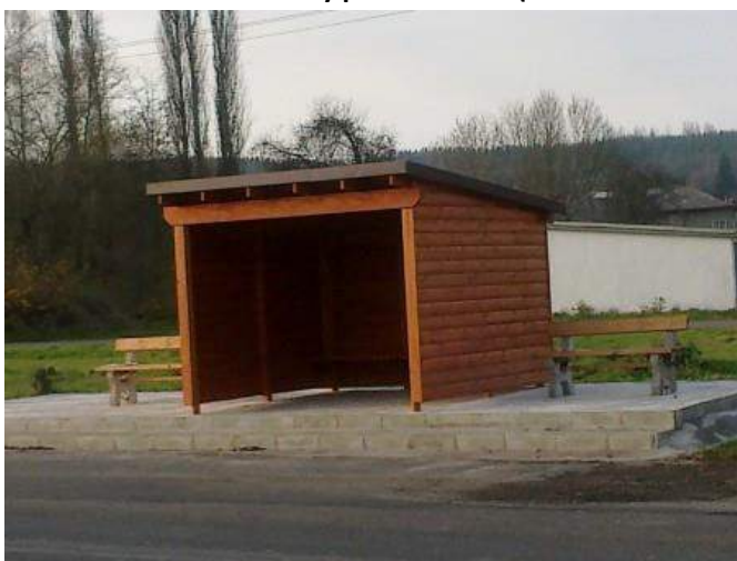
Obrázek 39: Ukázka tvorby pana Vacheta (autobusová zastávka)