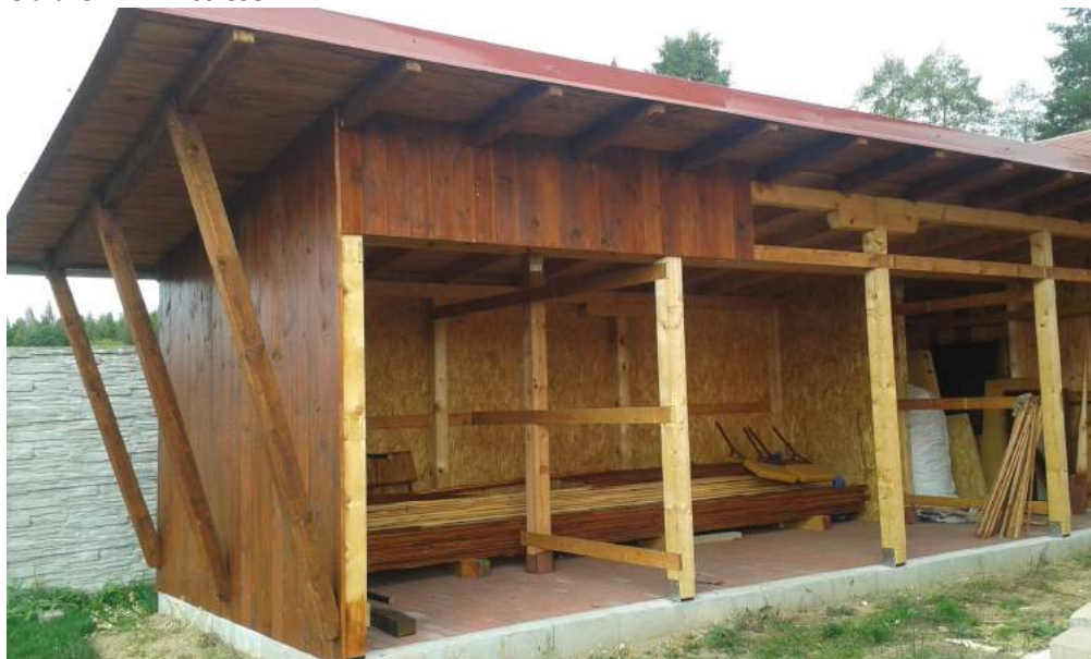
Obrázek 27: Přístřešek