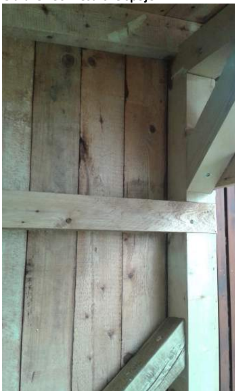
Obrázek 30: Tesařské spoje