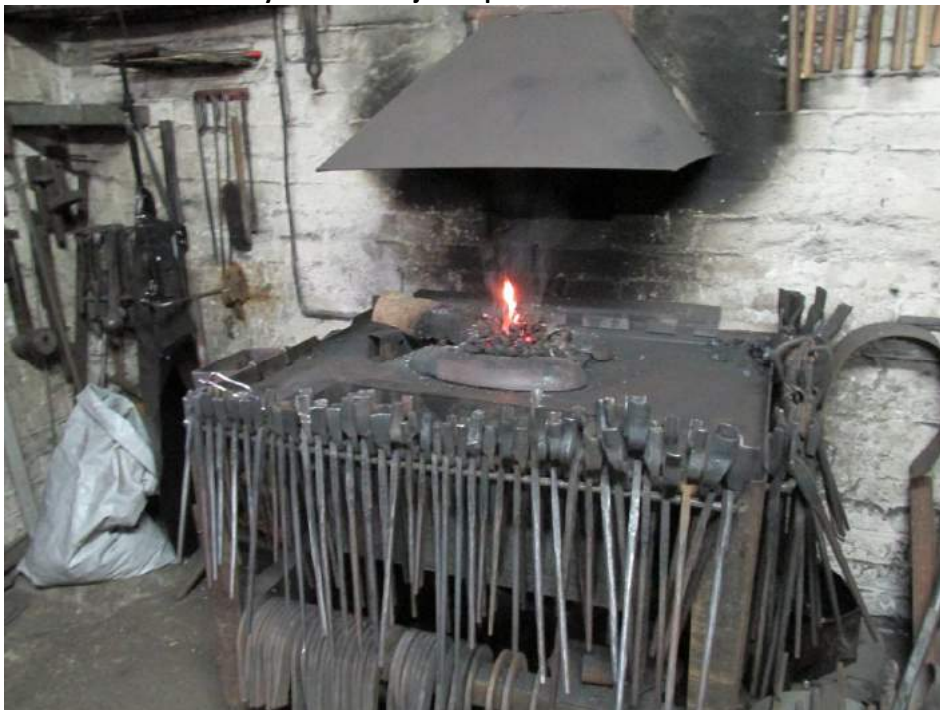
Obrázek 45: Kovářská výheň a nástroje na zpracování železa

Rudolf. V rámci Kovářského společenství se pořádají každoročně Mezinárodní kovářská symposia v Bečov nad Teplou. Letos již 9. ročník probíhal na téma botanika. Kovářské společenství se snaží na tuto akci nalákat co nejvíce kovářů, aby mohli předvést své řemeslo veřejnosti.