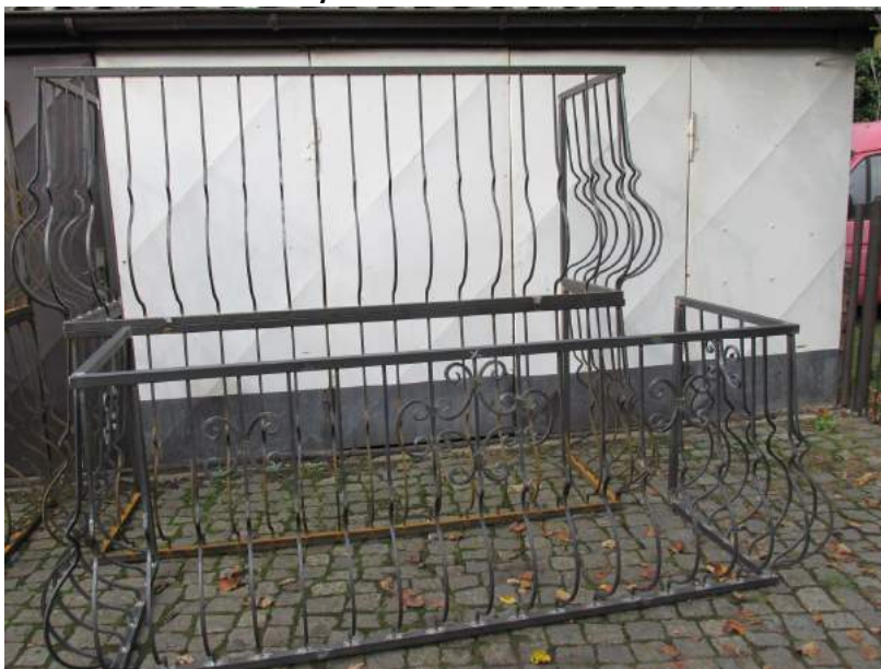
Obrázek 47: Ukázka tvorby

Vyuffívá spí-e vzory, které pofladují zákazníci (zákazník p inese obrázek anebo fotografii a on podle n j tvo í p edm t), umí d lat r zné repliky (n které mají vzory nap . kv tin, list ).