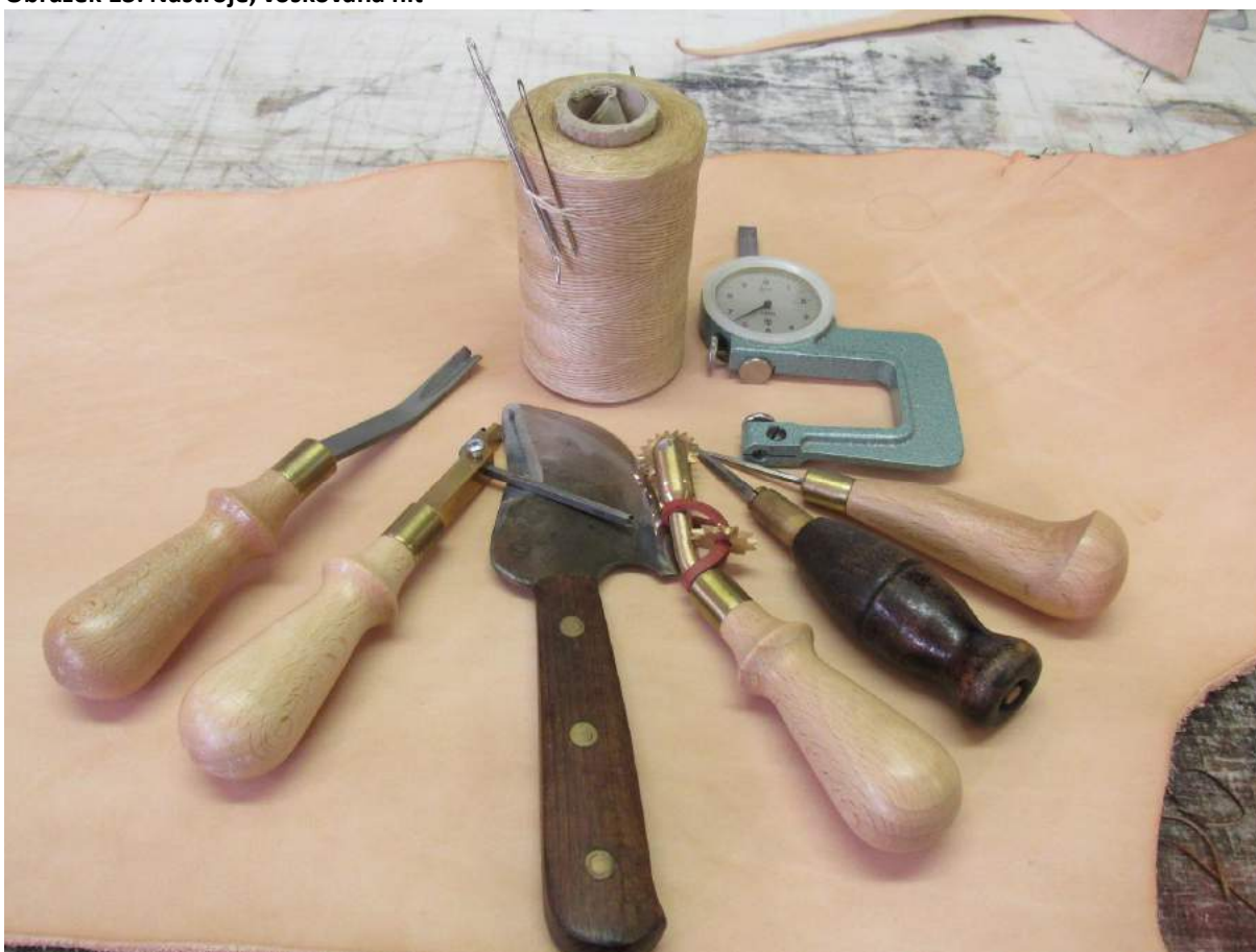
Obrázek 13: Nástroje, voskovaná nit

Stroje: pr myslový -ící stroj, -erfka (na ten ení k fle), vysekávací lis.