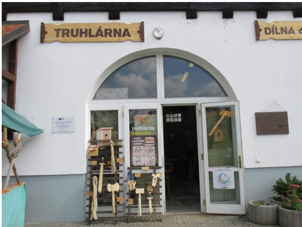
Obrázek 31: Truhlárna na Statku Bernard

Na Statku Bernard pracuje v truhlárně již 2,5 roku. Ale již předtím se po několik let truhlářinu učil sám.