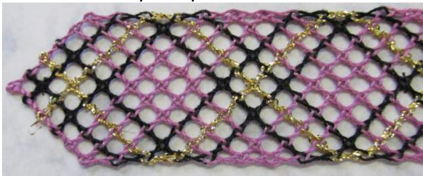
Obrázek 7: Detail záložky do knihy