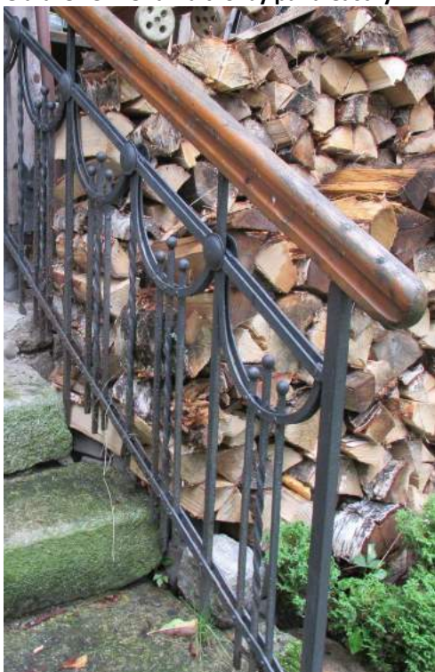
Obrázek 57: Ukázka tvorby pana Částky