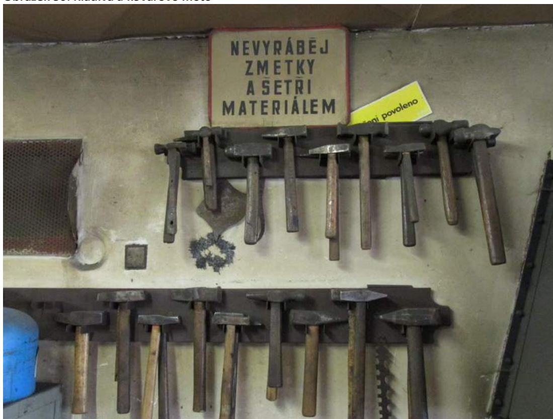
Obrázek 50: Kladiva a kovářovo moto

Kovář popsal také rozdíl mezi kovářstvím a umleckým kovářstvím. Kovářství je zaměřené spíše na kování nástrojů, jako jsou krumpáče, okřety, majzlíky atd. Umlecké kovářství je podle něj dnes spíše umlecké záležitost. Rozdílem mezi prací v minulosti a současnosti jsou odlišné metody. Dříve se používaly ke spojení železa nýty a dnes se spíše svařuje. Nýtování trvá déle, ale vyznačuje se větší pevností.