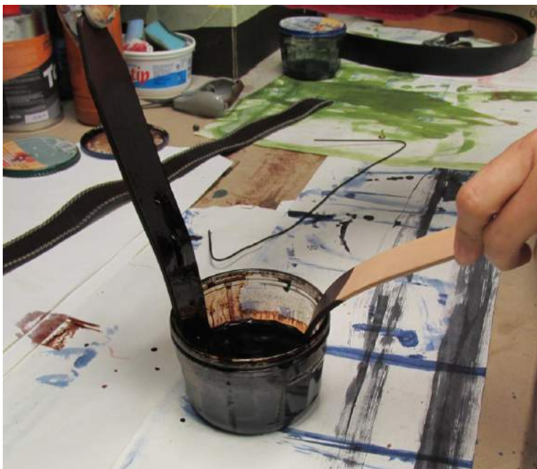
Obrázek 16: Barvení