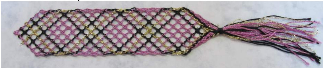
Obrázek 6: Záložka do knihy

3. Záložka do knihy ó podvinek pochází z píru ky, která byla p eloflena z angli tiny. Pouflitá technika: –íkmé oplétané plátenko. Postupným splétáním nakonec vznikne st apec ó tato technika se v eské kraje nevyškytuje. Na výrobu této krajky je pot eba 14 pár páli ek, cofl je velmi pracné na pípravu.