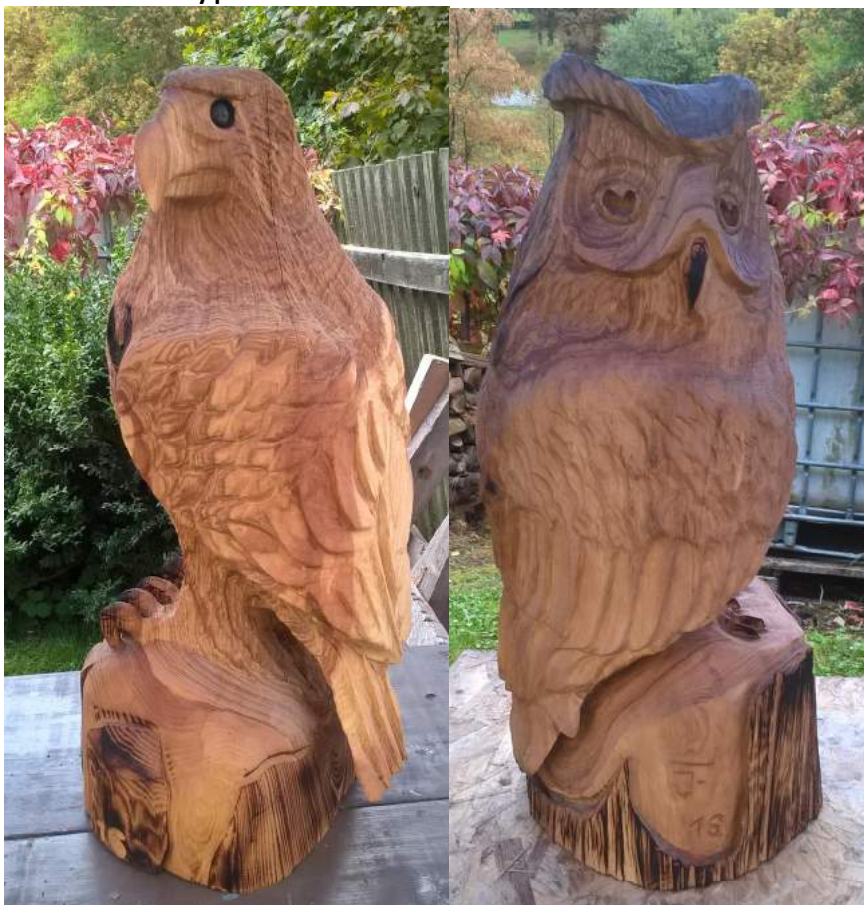
Obrázek 62: Sochy ptáků

Nyní rychle ezba motorovou pilou ó sochy pták ó orli, sovy, chrli , postavy v fivotní velikosti.