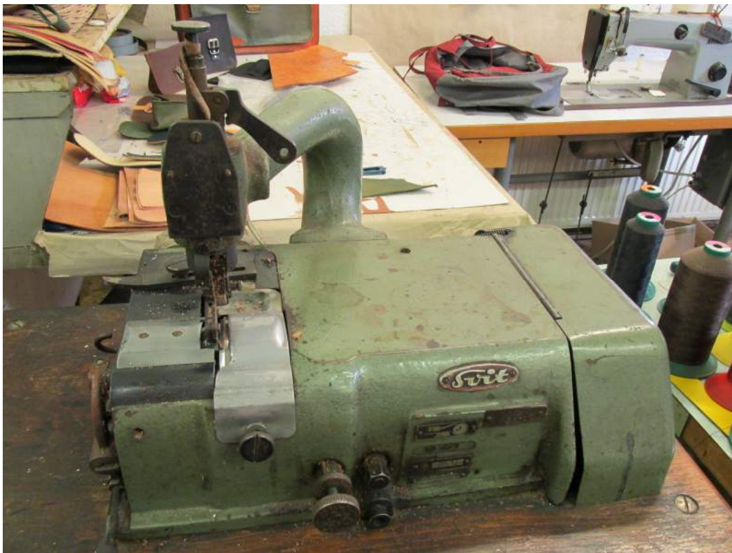
Obrázek 15: Šerfka