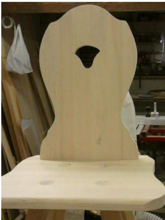
Obrázek 38: Židle a stůl vyráběné tradiční metodou

zajišťují pomocí kolíků. Tuto metodu využívá, pouze pokud je požadovaná v zakázce, protože je časově náročnější.