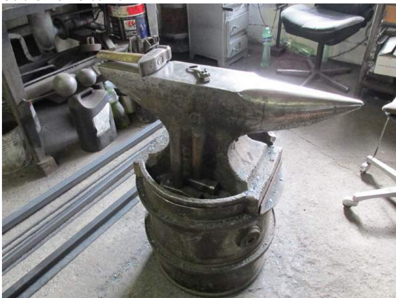
Obrázek 49: Kovadlina