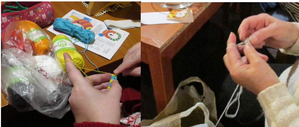
Obrázek 3: Háčkování a pletení